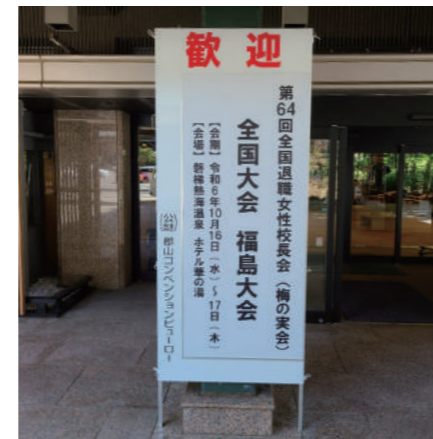
▲特別支援として会場前看板も設置しています。 ※東北大会以上かつ参加者200名以上の大会等が対象

対策の基本となるサーマルカメラの貸し出しをはじめ、学会や大会開催をサポートする体制も充実させてきた。また、運営・設営を担う地元企業の紹介、会議物品の無償貸し出し、最大750万円の開催経費に対する助成金に加え、主催者の課題となる会場・宿泊・食事・交通に関し一度に解決するための「コンベンション相談会」の開催など、こうした支援の積み重ねが、郡山でのMICE回復を後押ししている。