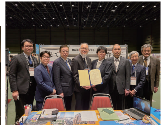
▲2024年度日本政府観光局「国際会議誘致・開催貢献賞」 【国際天文学連合 アジア太平洋地域の天文学に関する国際会議(APRIM2023)】

DATA 公益財団法人 郡山コンベンションビューロー 所在地 〒963-8004 福島県郡山市中町10-6 3階 TEL.024-991-1811 FAX.024-991-1812