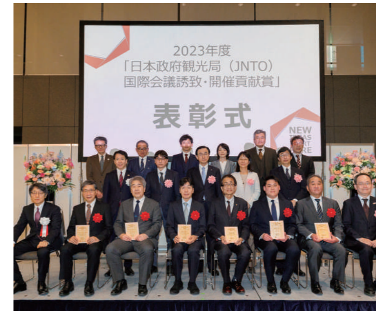
▼2023年度日本政府観光局「国際会議誘致・開催貢献賞」 表彰式【国際青年原子力会議(IYNC2022)】

※MICE:Meeting(会議)、Incentive tour(観光旅行)、Convention(大会)、Exhibition/Event(展示会・イベント)の頭文字を使った造語