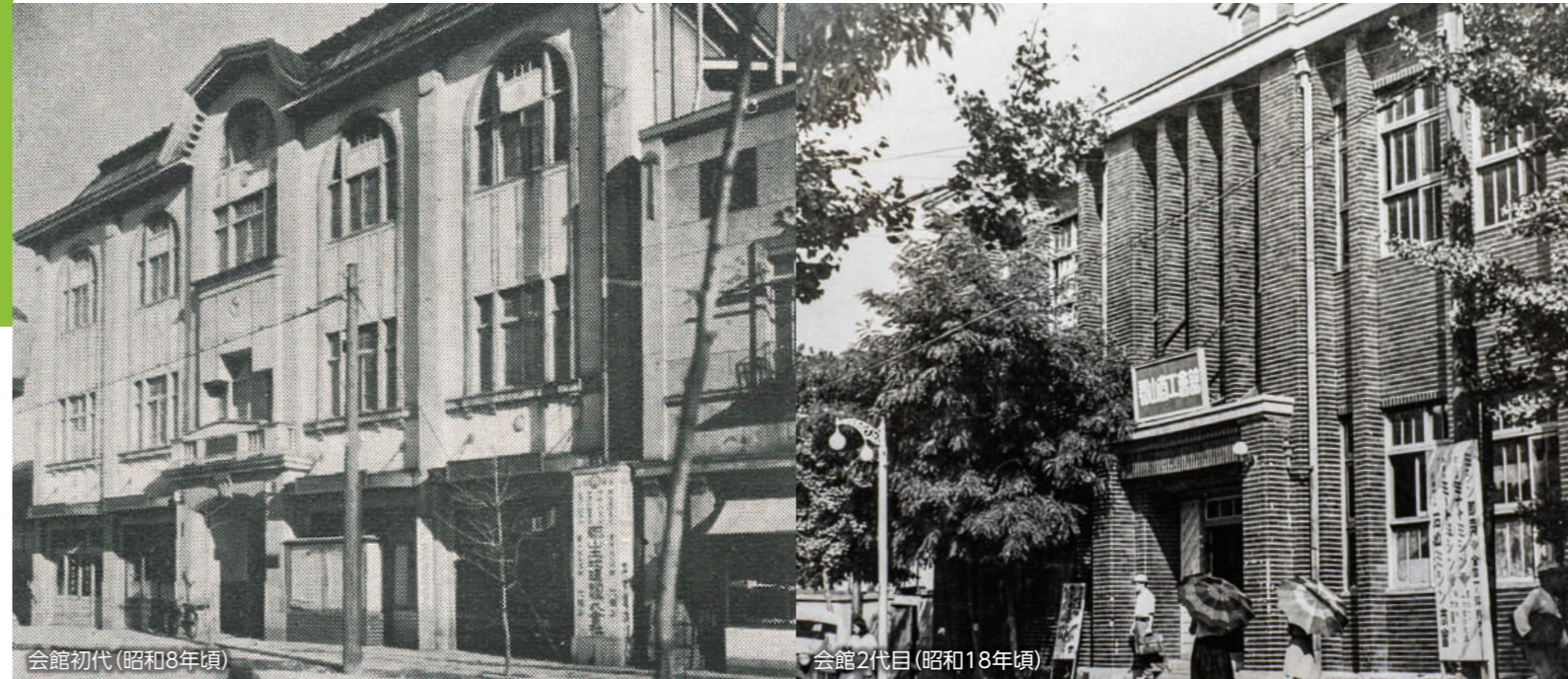
会館初代(昭和8年頃)