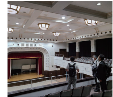
▲会場下見のアテンドも行います ※写真は郡山市公会堂

今後も、多言語対応メニューの整備、英語版マップの作成、バスの乗り方ガイドの充実など、海外から来た人がより快適に滞在できる環境づくりを地域事業者の皆様とともに進めていく方針だ。