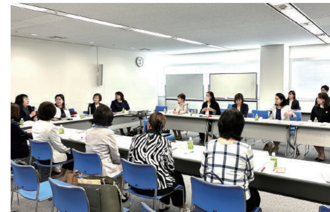
5月22日(水)開催 県女連理事會・役員會の様子

環境・福祉委員会と企画・研修委員会の両委員会では、会員アンケートをもとに、今年度の視察研修会の行き先や内容についての話し合いを進めております。今年度は市内の先進施設の見学をメインに、会員の新たな学びに結び付く研修会になるよう、内容を吟味してまいります。