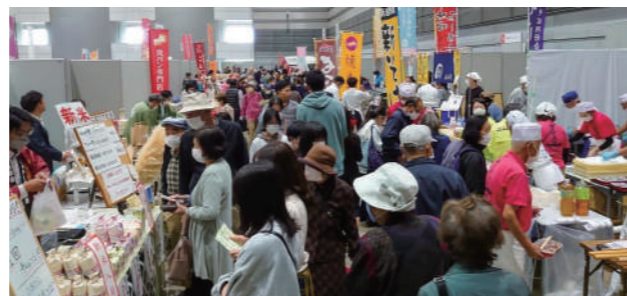
昨年の会場の様子